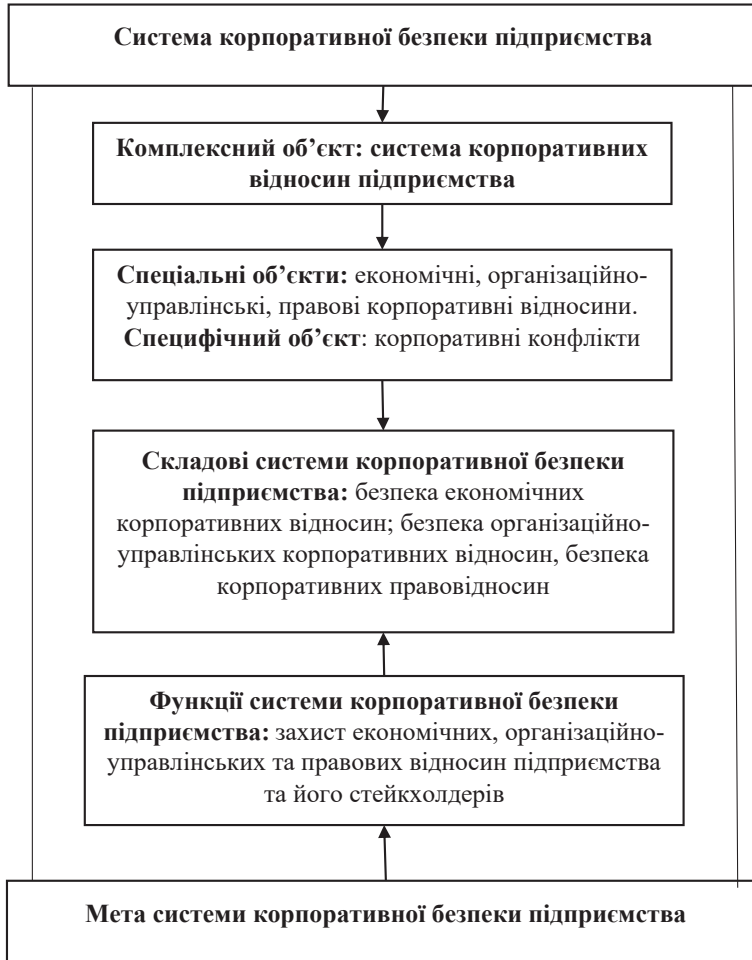
Рисунок. Структурно-функціональна модель системи корпоративної безпеки підприємства