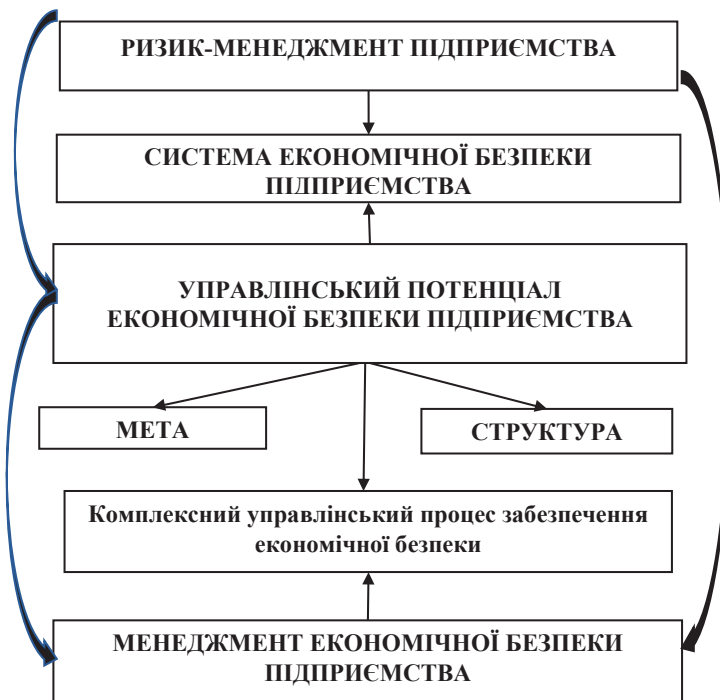
Рис. 2. Управлінський потенціал економічної безпеки підприємства в системі ризик-менеджменту підприємства

Управлінський потенціал економічної безпеки – це сукупність стратегічних і тактичних цілей, напрямів, управлінських рішень, засобів, заходів, технологій діяльності управлінського персоналу підприємства з метою забезпечення безпеки бізнесу та досягнення його цілей в умовах загроз і ризиків його зовнішнього та внутрішнього середовищ. Управлінському потенціалу притаманна забезпечувальна функція щодо досягнення: 1) необхідного рівня ефективності реалізації потенціалу економічної безпеки в цілому та кожного з його складників; 2) позитивного синергетичного ефекту функціонування системи економічної безпеки, підсистеми якої є взаємопов’язаними та комплементарними, шляхом прогнозування, запобігання, подолання деструктивних наслідків загроз економічній безпеці у поточному та довгостроковому періодах (рис. 2).