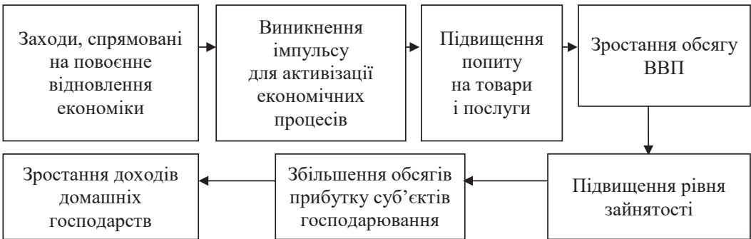
Рис. 2. Механізм впливу заходів з повоєнного відновлення на динаміку економічних процесів

Щоденні обстріли, вимкнення електропостачання вкрай негативно впливають на функціонування та розвиток суб'єктів господарювання в Україні й завдають значних втрат економіці країни загалом. Водночас функціонування українських підприємств в умовах воєнного стану забезпечує наповнення державного та місцевих бюджетів і створення робочих місць. Суб'єкти підприємницької діяльності оперативно реагують на зміни кон'юнктури ринку, надаючи економіці потрібної гнучкості, що закладає надійне підґрунтя для її відновлення. Механізм впливу державної політики на економічні процеси при здійсненні повоєнного відновлення наведено на рис. 2.