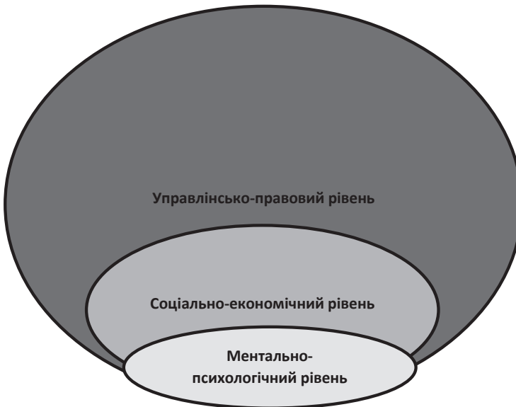
Рис. 2. Основні рівні дисбалансу (неузгодженості) бізнес-мотивів доходу і безпеки

Дисбаланс бізнес-мотивів підприємницького доходу і безпеки є багаторівневим (рис. 2) і охоплює: