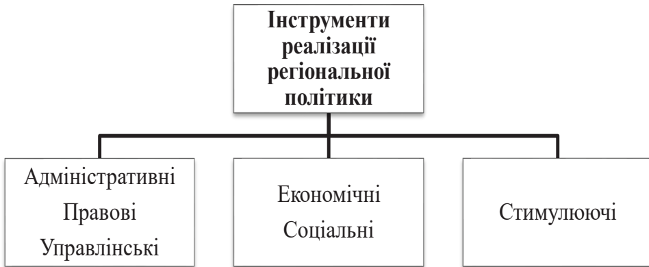
Рис. 2. Інструменти реалізації регіональної політики

На основі врахування закордонного досвіду й української практики в рамках досягнення мети – управління сталим розвитком територій – доцільним є сформувати інструменти реалізації регіональної політики. Структуруємо їх і представимо на рис. 2.