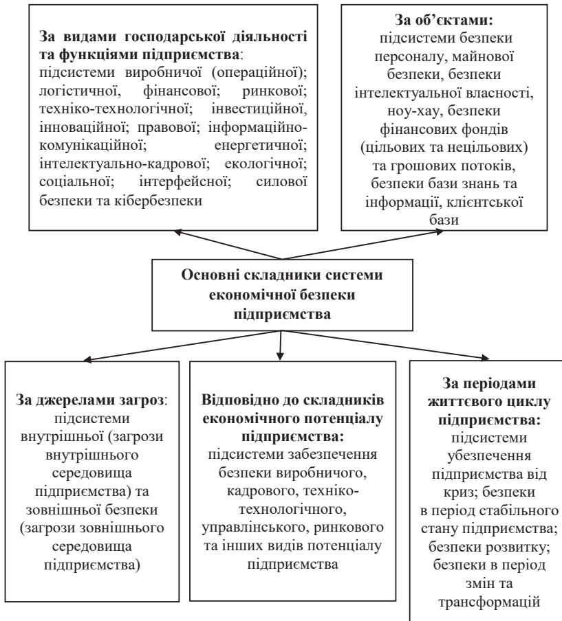
Рис. 1. Основні складники системи економічної безпеки підприємства

Визначення видів бізнес-консалтингу економічної безпеки спирається на певні критерії їхньої класифікації: