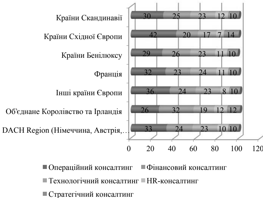
Рис. 2. Частка сегментів на ринку консалтингу Європи

Закордонний досвід показує, що найбільш затребуваним є операційний консалтинг, який займає близько 30% ринку консалтингових послуг. Потім, у порядку зменшення частки на ринку, слідують фінансовий, технологічний і HR-консалтинг. Найменшу частку на ринку має стратегічний консалтинг. Європейський ринок консалтингових послуг (за сегментами) має таку структуру (рис. 2) [21].