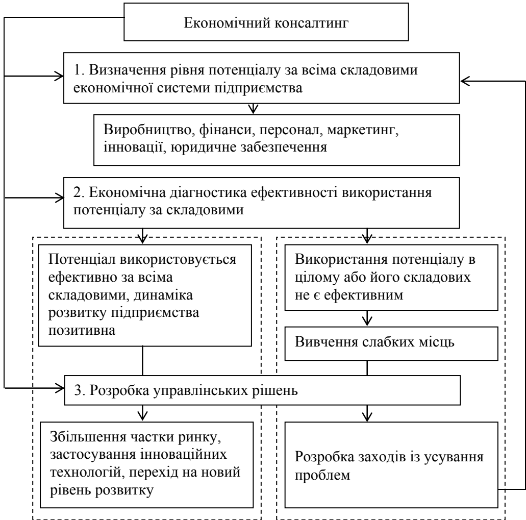
Рис. 3. Алгоритм проведення економічного консалтингу

Реалізація такого алгоритму дозволяє не тільки комплексно підійти до проблеми оцінки ефективності діяльності підприємства і виявити наявні проблеми, а й розробити управлінські рішення з урахуванням усіх аспектів економічної діяльності підприємства. Надалі це дозволить підвищити ділову репутацію підприємства, а також дасть можливість суб'єкту господарювання підвищити свій рівень соціальної відповідальності, оскільки він буде мати у своєму розпорядженні необхідні для цього ресурси.