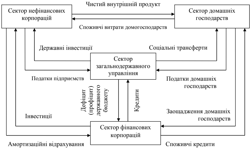
Рис. 1. Модель функціонування економіки з урахуванням впливу держави

Зростання обсягу інвестицій сприяє розвитку виробництва та неодмінно має викликати підвищення рівня зайнятості населення й зростання його доходів, частина з яких також може розглядатися як інвестиційні ресурси. Саме тому збільшення обсягів державних інвестицій обумовлює зростання ВВП. У результаті фінансові суб'єкти акумулюють більші обсяги коштів, що надає їм змогу нарощувати кредити підприємницькому сектору й на основі цього збільшити обсяг приватних інвестицій [10, с. 142–143]. Трансформації у виробництві, ускладнення економічних зв'язків, посилення державного впливу на економіку – такий причинний зв'язок дійсно досить чітко виявляється протягом усіх описаних вище етапів еволюції економічних функцій держави. Витрати на споживання в державному секторі та витрати на придбання інвестиційних товарів відносять до державних закупівель товарів і послуг. Використовуючи бюджетні видатки, держава може маніпулювати сукупним попитом, рівнем цін і зайнятості, а також обсягом національного виробництва, доходу й іншими макроекономічними показниками [9, с. 97–99].