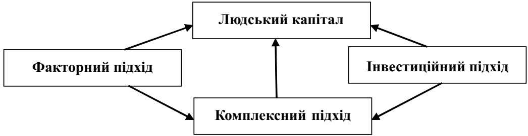
Рис. 1. Головні підходи до визначення змісту економічної категорії «людський капітал»

У факторному аспекті людський капітал як чинник суспільного виробництва тлумачиться у зв'язку з такими категоріями, як робоча сила, ресурси. Це сукупність здатностей людини, що виступає фактором суспільного виробництва та зростання вартості. Так, М. Довбенко, розкриваючи наукові здобутки Т. Шульца, пише: «Згідно з теорією людського капіталу у виробництві взаємодіють два фактори — фізичний капітал (засоби виробництва) і людський капітал (здобуті знання, навички, енергія, що можуть бути використані у виробництві товарів та послуг) [4, с.180]. Н. Томчук вважає, що виділення фактора «людського капіталу» дозволяє ідентифікувати принципово важливе джерело економічного зростання, яким є знання і кваліфікація [6, с. 98]. С. Клімов визначає людський капітал як сукупність здатностей, що забезпечують можливість їх носію отримувати дохід [7, с. 15].