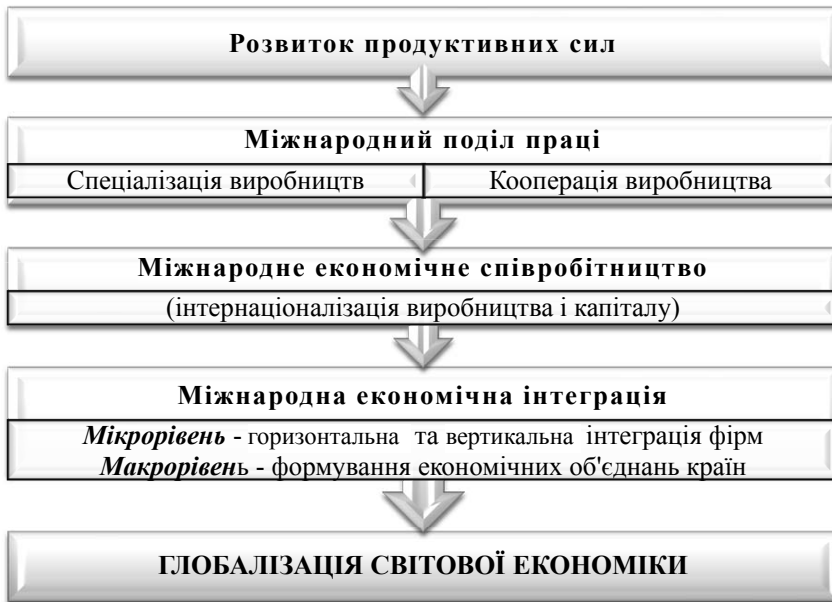
Рис. 2. Етапи розвитку глобалізації світової економіки

Вибуховий розвиток процесів транснаціоналізації на зламі ХХ–ХХІ ст. обумовив кардинальні зрушення у світовому господарстві та призвів до глобалізації економічного середовища, що пояснюється таким. До кінця ХХ ст. переважала інтернаціоналізація обміну, провідною формою міжнародної взаємодії була зовнішня торгівля. Наприкінці 90-х рр. основною формою міжнародної взаємодії стала інтернаціоналізація виробництва і капіталу, спричинена таким рівнем активізації діяльності ТНК, який дозволяє констатувати феномен явища транснаціоналізації.