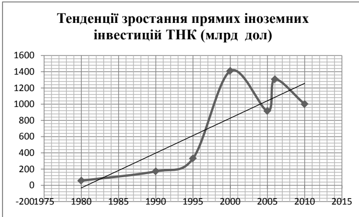
Рис. 3. Тенденції зростання прямих іноземних інвестицій ТНК

різноспрямований розвиток. Інтернаціоналізація економічної діяльності є наслідком дії закономірності міжнародного поділу праці як вияву об'єктивного економічного закону територіального поділу праці.