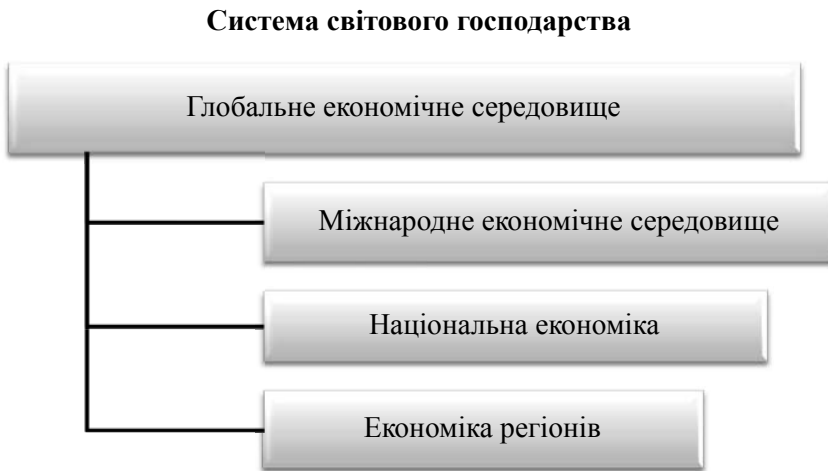
Рис. 5. Ієрархічна структура зовнішніх впливів на економіку регіону

У зв'язку з тим, що центральне місце у світовому господарстві нині посідають ТНК, попередні інструменти входження країни у світовий економічний простір не втратили актуальності, але більше не мають вирішального характеру. Практика доводить, що в сучасних умовах ні регіональні інтеграційні об'єднання, ні СОТ не здатні протистояти діяльності ТНК у разі негативного впливу на країну базування. Глобалізація економічного середовища перегруповує ступінь впливу діючих осіб на світовій арені (рис. 5) [4, с. 25].