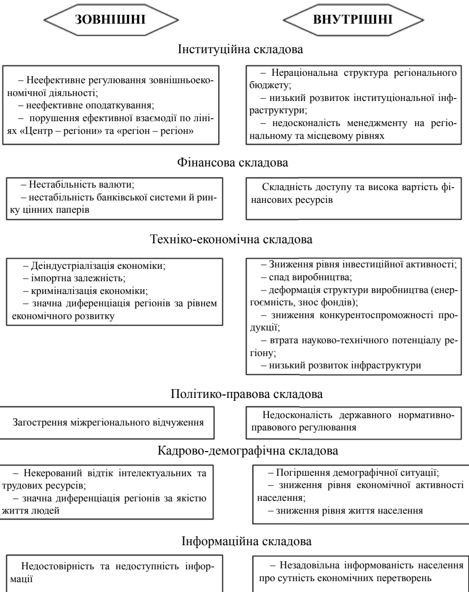
Рис. 6. Внутрішні та зовнішні загрози економічній безпеці регіону за структурними складовими

вання податкової системи, поліпшення інвестиційного клімату в регіонах країни, зокрема, шляхом забезпечення дієвого захисту права власності, вдосконалення регуляторного і корпоративного законодавства, обмеження монополізму, розвитку фінансового і фондового ринків.