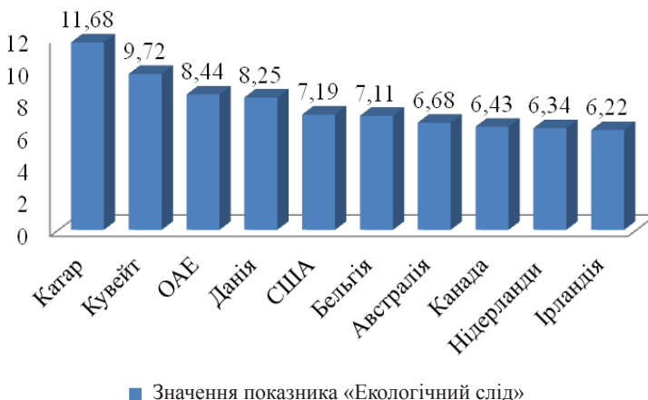
Рис. 3. Країни світу з найбільшим показником «екологічний слід» на душу населення 1

Незважаючи на те, що основна частина країн у цьому списку — це розвинуті країни, які займають позиції лідерів у рейтингах за такими індексами, як Індекс розвитку людського потенціалу, Індекс процвітання країн світу, Індекс глобальної конкурентоспроможності, Індекс якості життя тощо, ці країни мають найбільші обсяги споживаних ними товарів і послуг, а також ресурси, використані при виробництві цих товарів і послуг, і відходи, що при цьому утворилися.